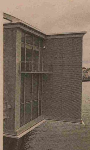
Sede de la Fundación Botín en Santander.

El primer evento en arrancar serán las Jornadas profesionales de galerías de arte contemporáneo , una primera edición organizada por el Consorcio de Galerías y que acogerá la sede de la Fundación Botín entre el 12 y el 14 de ese mes.