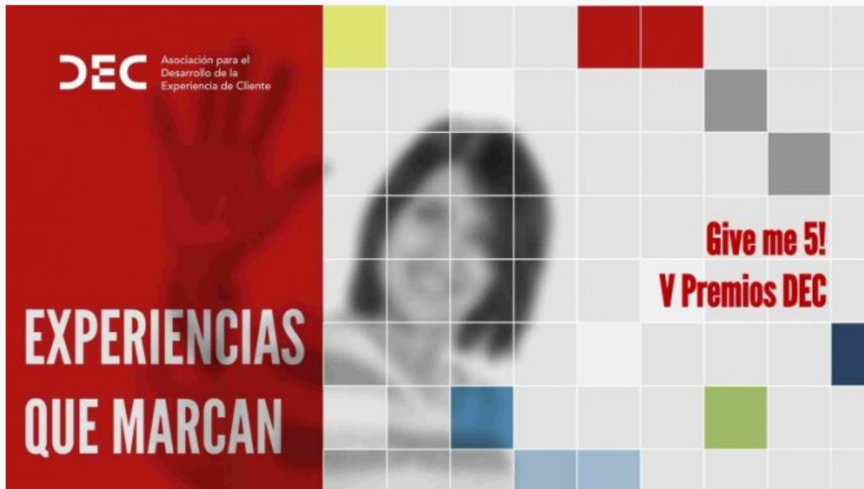
Quinta edición de los Premios DEC

EFEEMPRESAS | MADRID | MIÉRCOLES 23.05.2018