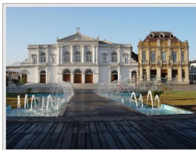
Cencientecno Chile -imagen de archivo-

| ROIPRESS | CHILE - Tras seis años, desde su creación, desarrollando contenidos, iniciativas y organizando actividades dirigidas a sus asociados, aportándoles visión global, oportunidades de encuentro, formación,... la Asociación para el Desarrollo de la Experiencia de Cliente (DEC) ha dado un paso más en su estrategia y ha decidido expandir su conocimiento y sus servicios, con el inicio de actividades en Chile.