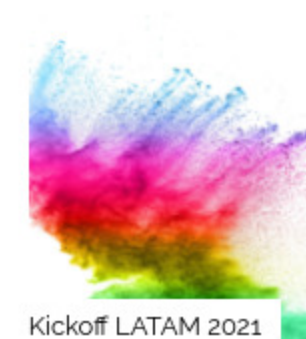
Kickoff LATAM 2021