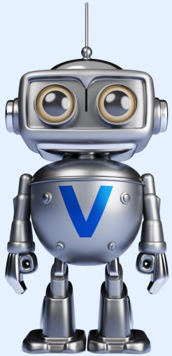
Performance Scoring Bot

Más ejemplos: Cada Bot está dedicado a una sola tarea que ayuda a mejorar la productividad de la empresa