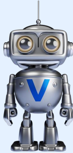
CX Prediction Bot (Analyst)