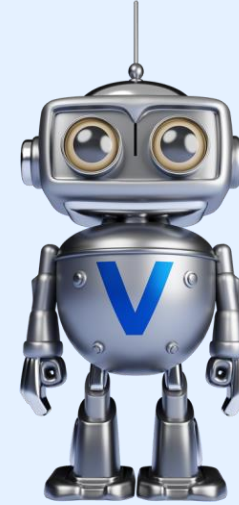
R-T Sentiment Bot

Reduce el after-call work en 60 segundos